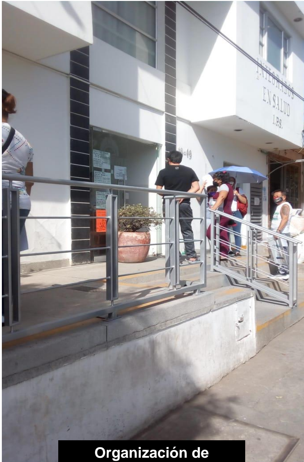
Organización de usuarios en la entrada de la IPS